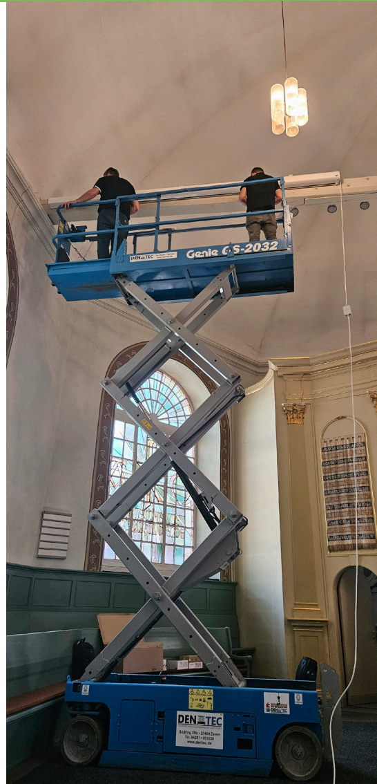
Installation der Leinwand