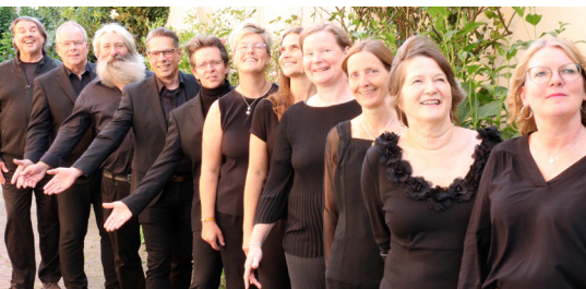
Corona-Ensemble & friends