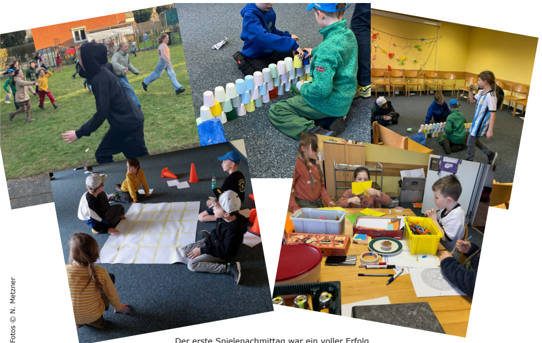
Der erste Spielenachmittag war ein voller Erfolg