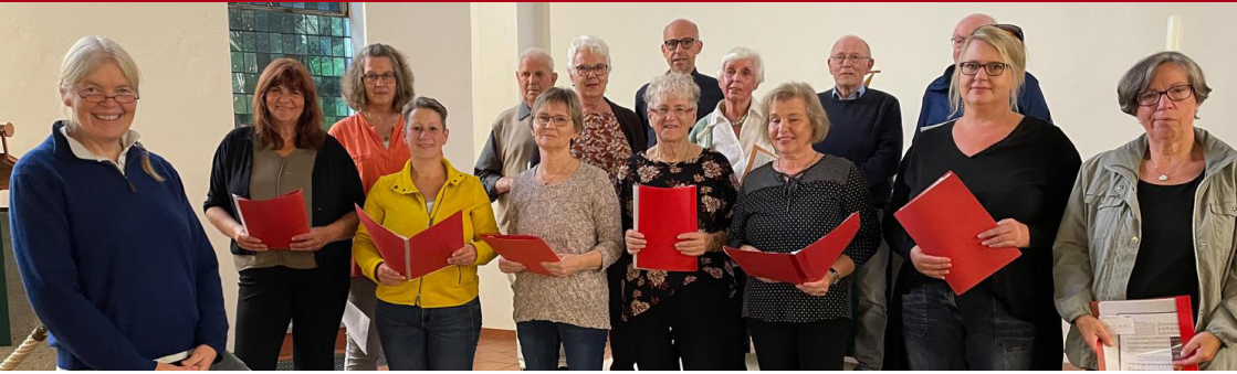
Gemischter Chor Sandbostel