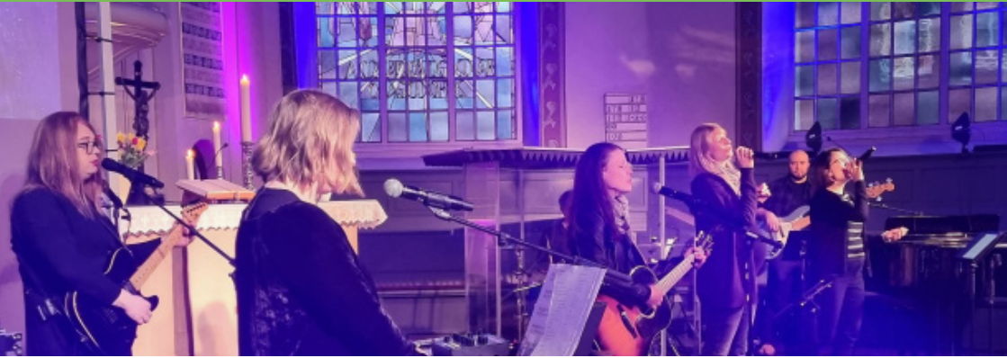
Water + Wine beim Primetime Gottesdienst