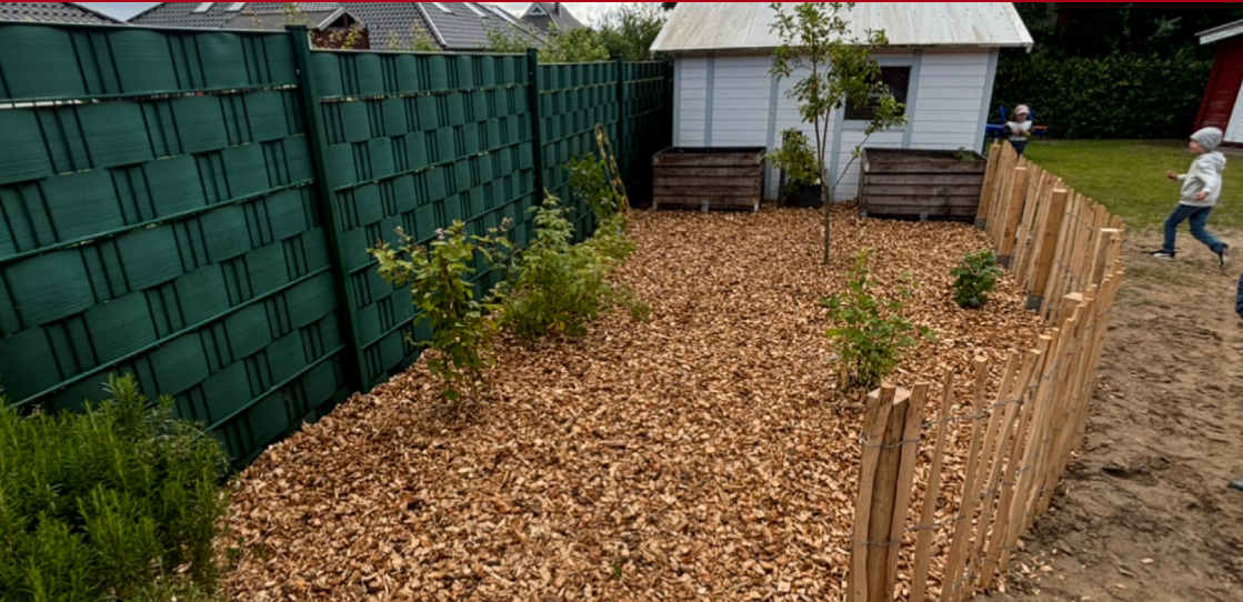
Die Kinder hoffen auf eine reiche Beerenenernte im neuen „Schrebergarten“